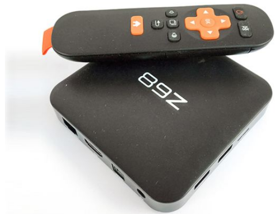
Onze 'Z68' settopbox blijkt verrassend capabel te zijn.

duur hoeft het ook nu weer niet te zijn, wij tikten zo'n kastje – met typenummer 'Z68' - voor circa €35 via eBay op de kop. Onder de motorkap treffen we een octo core-processor aan, ofwel een processor met maar liefst 8 kernen. Dat is vergelijkbaar met wat u tegenwoordig in midrange en high-end mobieltjes aantreft, dus qua snelheid zit het wel goed. Erg prettig is de hoeveelheid RAM (werkgeheugen) van 2 GB. Daarop draaien ook zware apps en games prima. Een nette 3D videochip completeert het geheel. Praktisch zijn de gewone USB-aansluitingen die u op dit soort kastjes aantreft, hierop kunt u desgewenst een gewone pc-muis en dito toetsenbord aansluiten. Feitelijk is een Android-kastje daarmee ook prima inzetbaar als een micro-pc! Sommige van dit soort kastjes beschikken zelfs over een ingebouwde webcam.